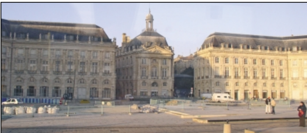
Bordeaux, grad odakle stoljećima u svijet odlaze čuvena francuska vina iz okolnih vinograda

A u Parizu - kojemu kao gradu putnici nisu imali priliku pogledati u dušu jer nije bilo vremena još i za šetnju metropolom, srećom da je ipak učinjen dobro i stručno vođeni razgled autobusom - prezentacija hrvatskoga vina organizirana je i realizirana vrlo loše. Kako smo čuli, organizator je bilo Veleposlanstvo Republike Hrvatske. Prostor općenito nije bio nimalo reprezentativan, a unutar njega prostorijica sa stolicima uz koje su stajali naši proizvođači bila je skućena, jedva dovoljna za te stolice a kamo li još i za uzvanike. Kad su pozvani stigli, stvorila se gužva kao u prepunom zagrebačkom tramvaju u vrijeme špice, tako da je svaki iole ozbiljniji pokušaj degustacije vezan na upoznavanje s hrvatskim vinom bio nemoguć. Iako se, kako nam je rečeno, ova prezentaci-