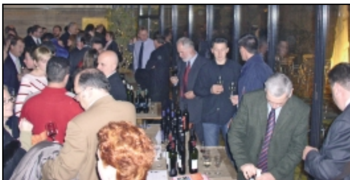
Prizor s nemušte prezentacije hrvatskih vina u Parizu